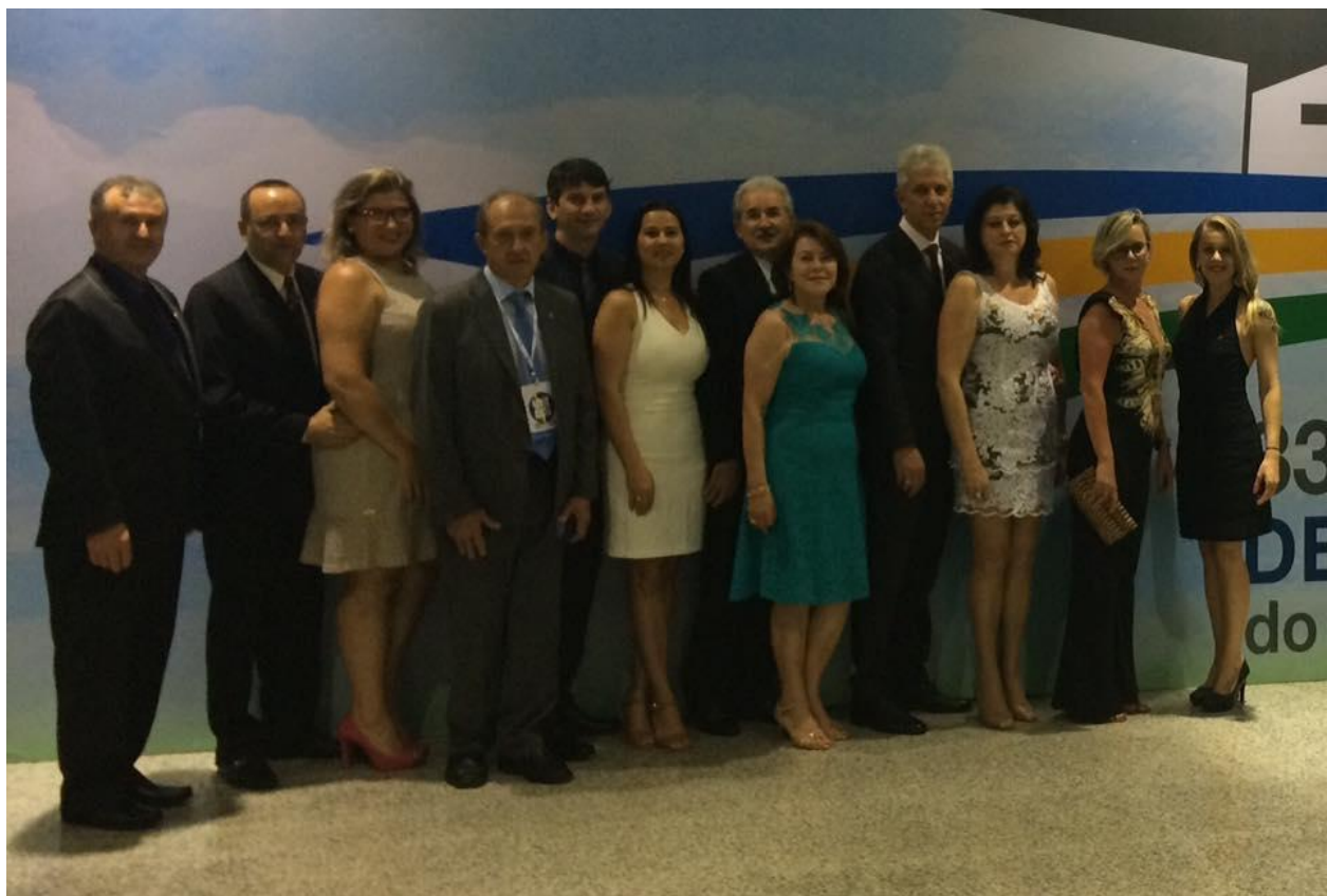
Nas foto acima parte da Comitativa do Sindilojas Nova Prata que participou da Abertura oficial do 33º Congresso Nacional de Sindicatos Empresariais do Comércio de Bens, Serviços e Turismo.